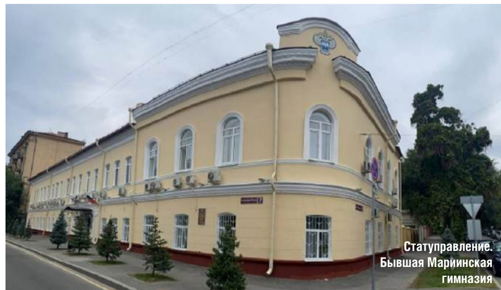
Статуправление. Бывшая Марииинская гимназия

В специальной экскурсии «Царицын купеческий» видят и посещают затерянные среди современных зданий неповторимые по архи-