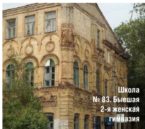
Школа № 83. Бывшая 2-я женская гимназия

В экскурсионной работе практикуются также игровые формы. Например, «Царицынский урок» с так называемым «погружением». Дети представляют себя учениками Марииинской гимназии: пишут перьевыми ручками, решают задачи, учатся правилам поведения и т. д. Урок заканчивается пением гимна. Это очень похоже на деятельность хорошего педагога, психолога или даже артиста.