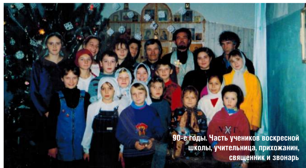
90-е годы. Часть учеников воскресной школы, учительница, прихожан, священник и звонарь

чу свои детские прегрешения мы писали на листочке и на исповеди подавали эти записочки батюшке. Он их внимательно читал, накрывал наши головы епитрахилью и отпускал нам грехи. Позже мы исповедовались по памяти самостоятельно.