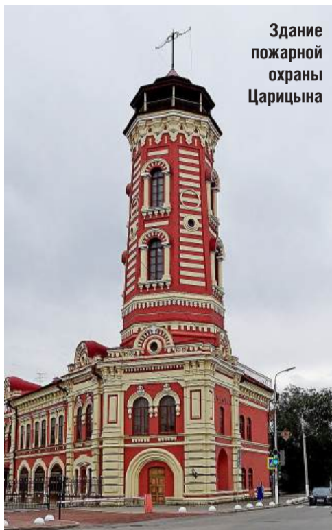
Здание пожарной охраны Царицына

Музейная жизнь как обычно не ограничивается выставочной деятельностью. В последние годы сотрудники участвовали в краеведческих чтениях, посвященных 800-летию со дня рождения князя Александра Невского, 350-летию Петра I, 80-летию Сталинградской битвы и др.