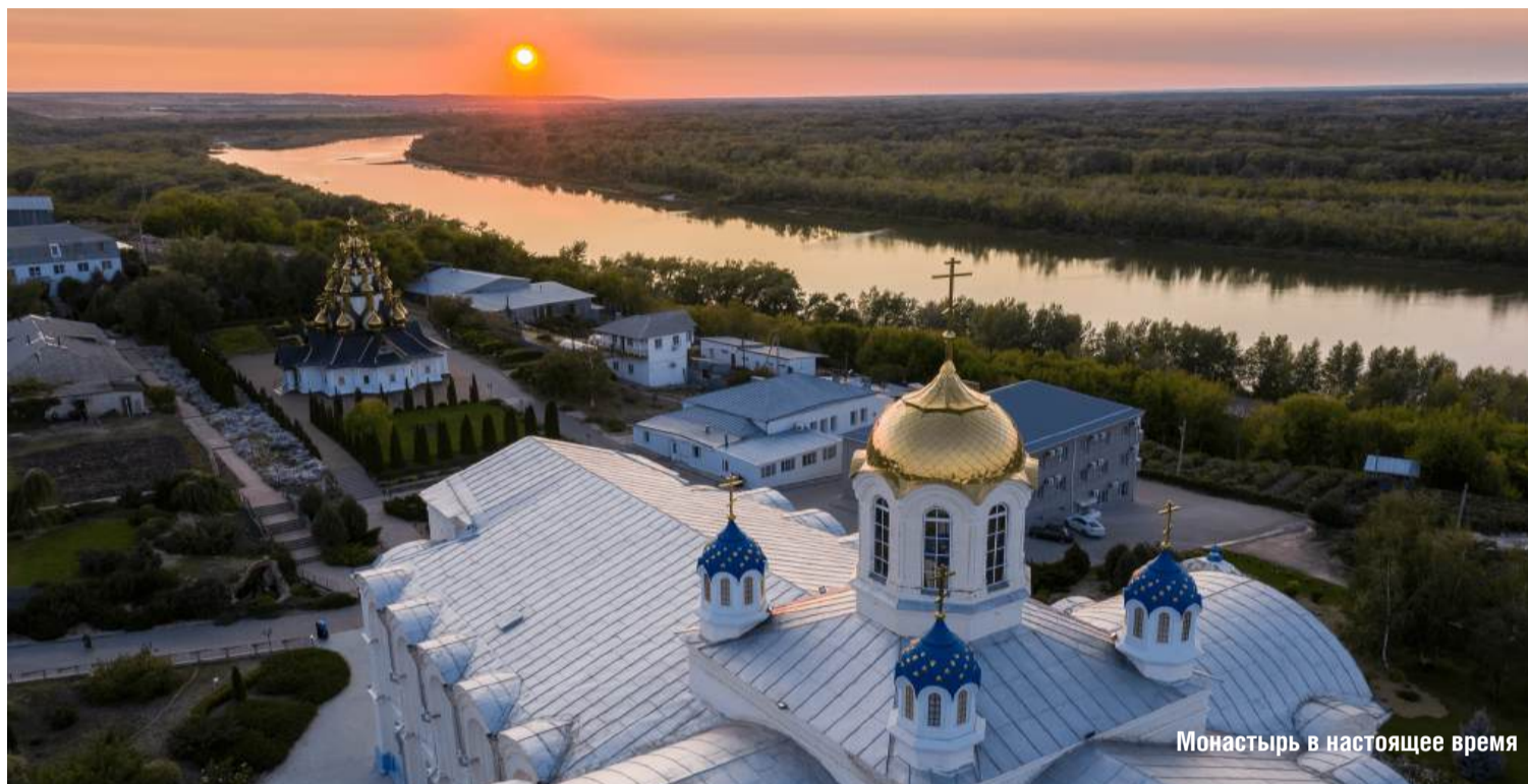
Монастырь в настоящее время