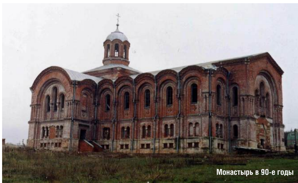
Монастырь в 90-е годы