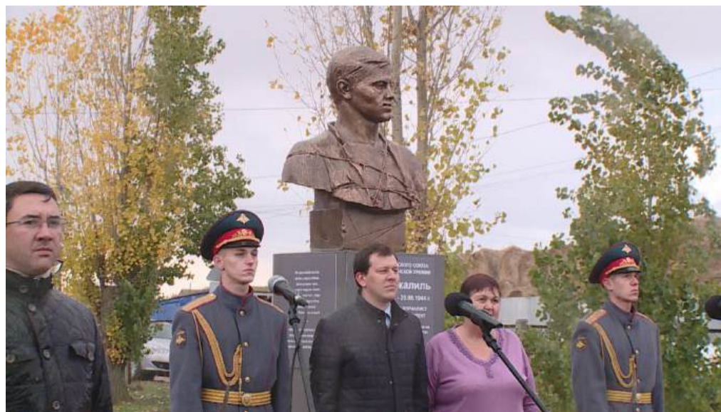
Открытие памятника Мусе Джалилю в селе Маляевка Ленинского района